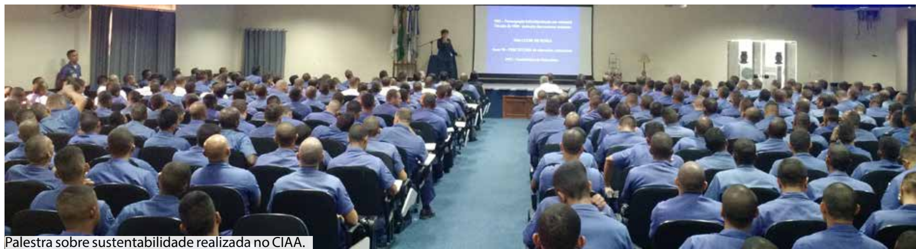
Palestra sobre sustentabilidade realizada no CIAA.

Lei de Diretrizes e Bases da Educação (LDB), Lei Nº 9.394, de 20 de dezembro de 1996 que em seu Art. 1º explica: “A educação abrange os processos formativos que se desenvolvem na vida familiar, na convivência humana, no trabalho, nas instituições de ensino e pesquisa, nos movimentos sociais e organizações da sociedade civil e nas manifestações culturais.” Nesse contexto, a participação voluntária continua a ser utilizada como uma ferramenta para melhoria da sociedade. Algumas fotografias ilustram essas práticas da Autarquia.