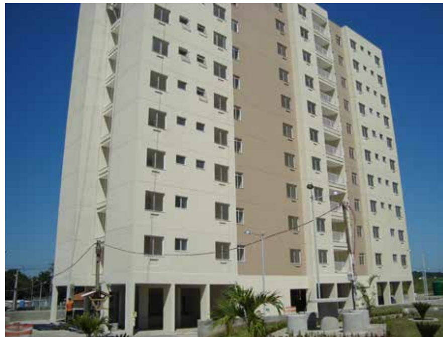
Vista bloco1- DEZ 2018

O Residencial Imigrantes é um projeto da CCCPM desenvolvido em associativo com a Caixa Econômica Federal (CEF). O projeto prevê 252 apartamentos distribuídos em 4 blocos, com área de lazer completa: playground, churrasqueira, quadra poliesportiva, piscina, salão de festas, academia, bicicletário, e vaga de garagem.