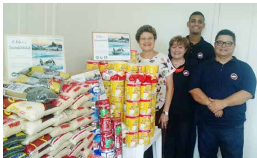
Entrega dos alimentos arrecadados

se com a Coleta Seletiva, em 2009, produzindo ao longo dos anos, exposições como forma de melhoria de processos, utilizando o trabalho de artesãos e artesãs da sustentabilidade, para reciclar todo o material arrecadado e coletado na CCCPM. Por desdobraimento, muitos objetos, caracterizados pela boa aparência e conservação ou sem utilidade, foram doados por colaboradores que, por motivos diversos, já não se utilizavam mais desses em suas residências. Dessa forma, foi possível, a partir de 2011, realizar exposições com essas contribuições, permitindo a participação de pessoas interessadas nesses objetos e, por meio de TROCAS INTELIGENTES, angariar alimentos, em especial leite em pó integral, para as diversas campanhas beneficentes apoiadas pela CCCPM. Face à arrecadação de alimentos oriundas da XV Exposição "O Belo e a Sustentabilidade" e do "Gesto Concreto do Círculo Bíblico" desta Autarquia, ambas realizadas em novembro deste ano, foram doados alimentos arrecadados para a Paróquia Nossa Senhora da Luz, localizada no Alto da Boa Vista, Rio de Janeiro. Essas iniciativas permitiram atender, com alimentos para cestas básicas, as mães carentes da Creche do TIJUAÇU e as gestantes apoiadas e orientadas a não praticar aborto no Projeto "Pró-Vida", tarefa sob a responsabilidade da Igreja beneficiada.