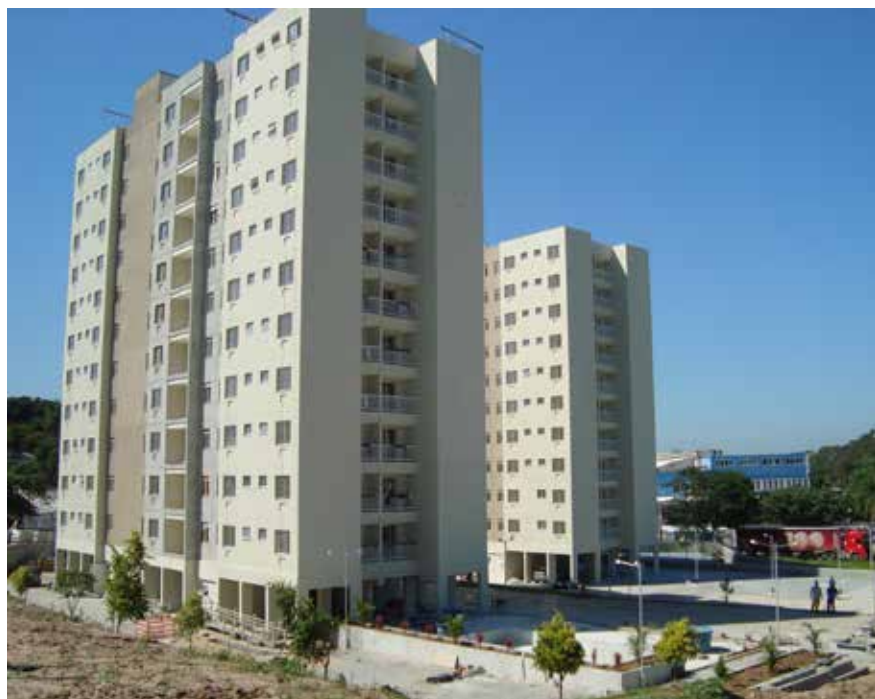
Vistas dos blocos 1 e 2 - DEZ 2018

O Residencial Imigrantes é um projeto da CCCPM desenvolvido em associativo com a Caixa Econômica Federal (CEF). O projeto prevê 252 apartamentos distribuídos em 4 blocos, com área de lazer completa: playground, churrasqueira, quadra poliesportiva, piscina, salão de festas, academia, bicicletário, e vaga de garagem.