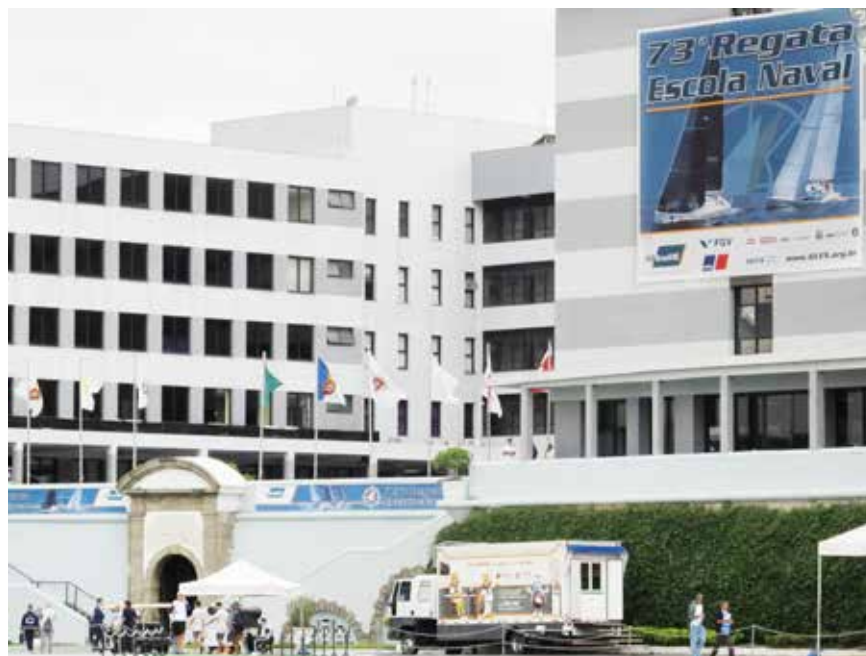
CCCPM presente no evento da 73ª Regata Escola Naval com a UMA.

As OM podem solicitar, à CCCPM, a qualquer tempo, por mensagem, a realização de palestras, bem como a presença da nossa Unidade Móvel de Atendimento, neste caso, apenas para as OM da Área-RIO.