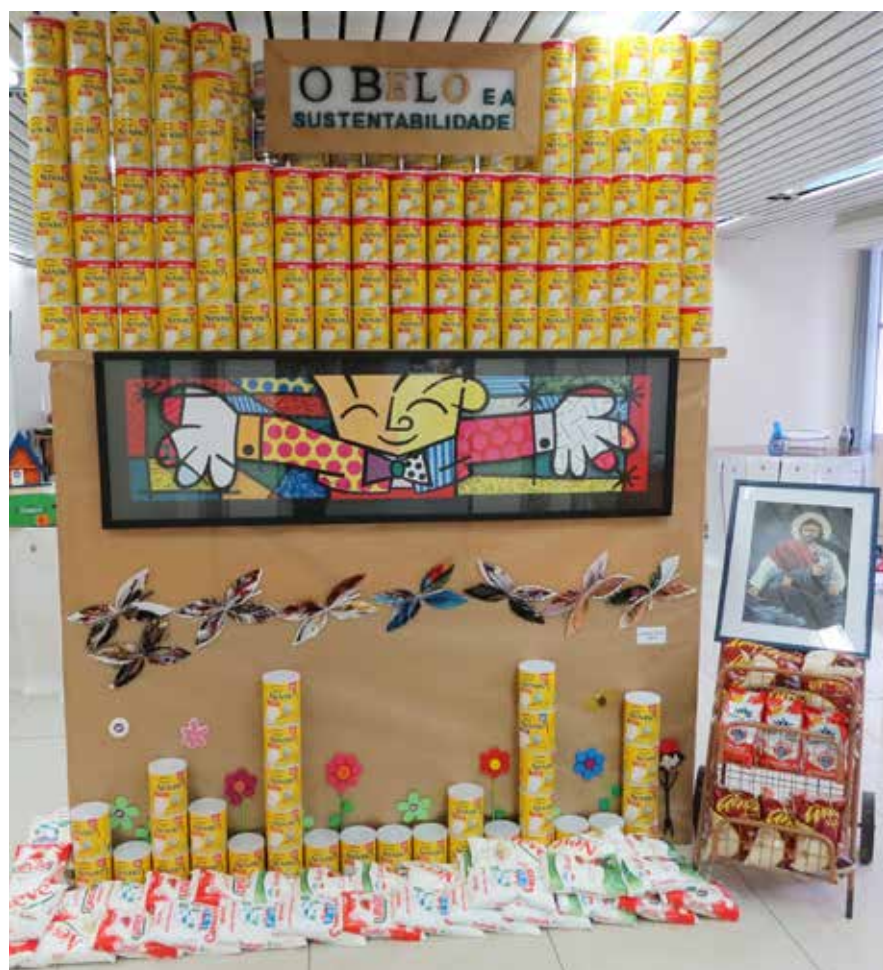
Alimentos arrecadados na exposição

A Caixa de Construção de Casas para o Pessoal da Marinha (CCCPM), nas atividades de sustentabilidade no ano de 2018, realizou, no mês de outubro, a XV Exposição "O Belo e a Sustentabilidade", resultando em uma grande demonstração de solidariedade da Força de Trabalho, arrecadando 342 kg de alimentos em prol de pessoas carentes. Com a gradativa mobilização dos componentes da CCCPM, foi inserida no cotidiano da Autarquia a importância da preservação ambiental. Iniciou-