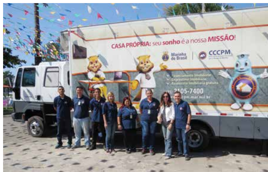
CCCPM presente no evento do Âncora Social com a UMA.

Estimamos para o ano de 2019, que estaremos presentes em mais OM, atenderemos uma quantidade superior de beneficiários e visitaremos pelo menos, mais dois Comandos de Distritos Navais.