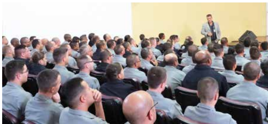
Palestra no CIAW

A programação fixada para 2019 conta com a realização de 53 palestras para cerca de 6.000 militares e servidores civis, lotados em mais de 60 Organizações Militares incluindo, em sua maior parte, OM da Área-Rio e aquelas subordinadas aos Comandos do 6º e 7º Distritos Navais, escolhidos para o ano de 2019.