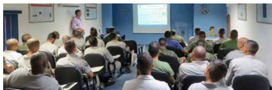
Palestra no CTecCFN