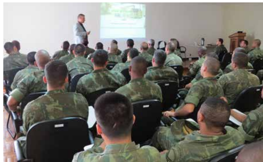
Palestra na CiaApDbq - Ilha das Flores

O contato direto com nosso público-alvo é uma oportunidade enriquecedora de duas vias, ao passo que, da mesma forma que apresentamos informações sobre produtos e serviços para nossos beneficiários, esses realimentam nosso sistema com sugestões e questões, as quais se transformam no aperfeiçoamento de nossos produtos e serviços, além de servirem também como novos requisitos para futuros empreendimentos residenciais.