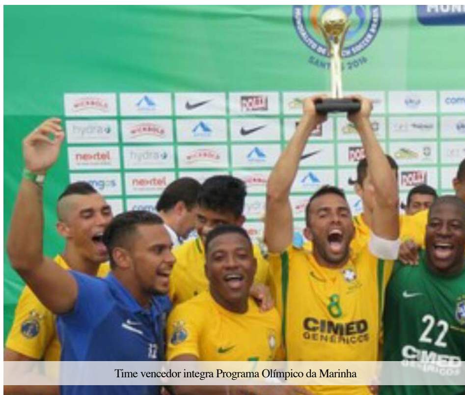
Time vencedor integra Programa Olímpico da Marinha

O Brasil sagrou-se campeão do Mundialito de Beach Soccer, no dia 23 de outubro, goleando a Itália por 8 a 2, em partida disputada na Praia do Gonzaga, em Santos (SP). A Seleção Brasileira possui uma parceria com a Marinha do Brasil, apresentando inclusive o brasão da Força, em posição de destaque, na manga