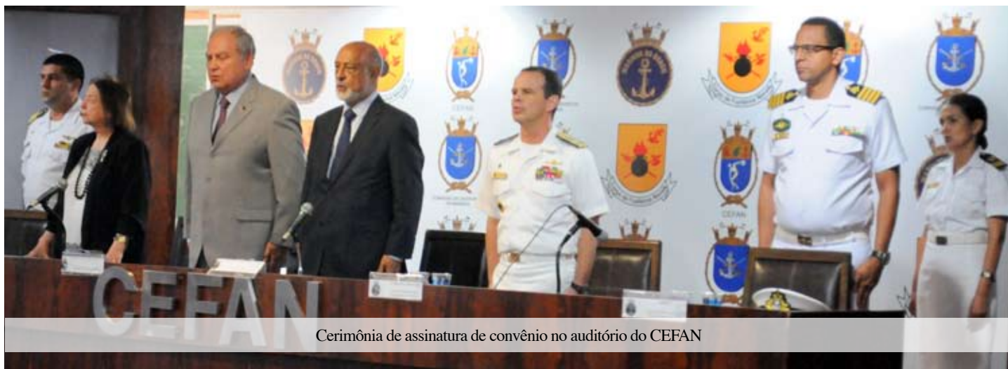
Cerimônia de assinatura de convênio no auditório do CEFAN