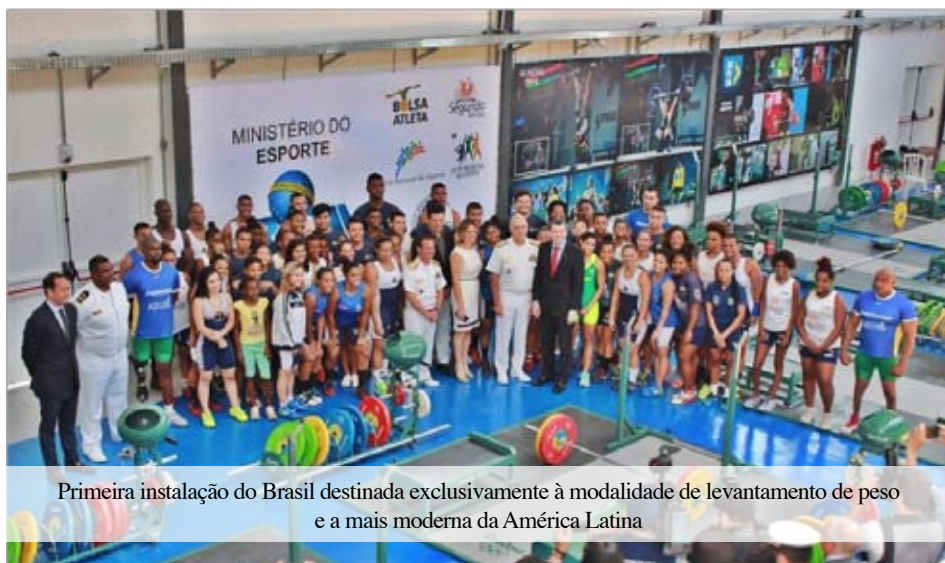
Primeira instalação do Brasil destinada exclusivamente à modalidade de levantamento de peso e a mais moderna da América Latina

Primeira instalação do Brasil destinada exclusivamente à modalidade e a mais moderna da América Latina já nasce plenamente aparelhada com os equipamentos de ponta adquiridos e utilizados nos Jogos Olímpicos de 2016.