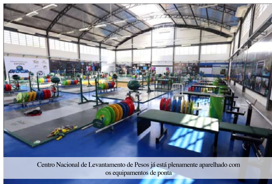
Centro Nacional de Levantamento de Pesos já está plenamente aparelhado com os equipamentos de ponta