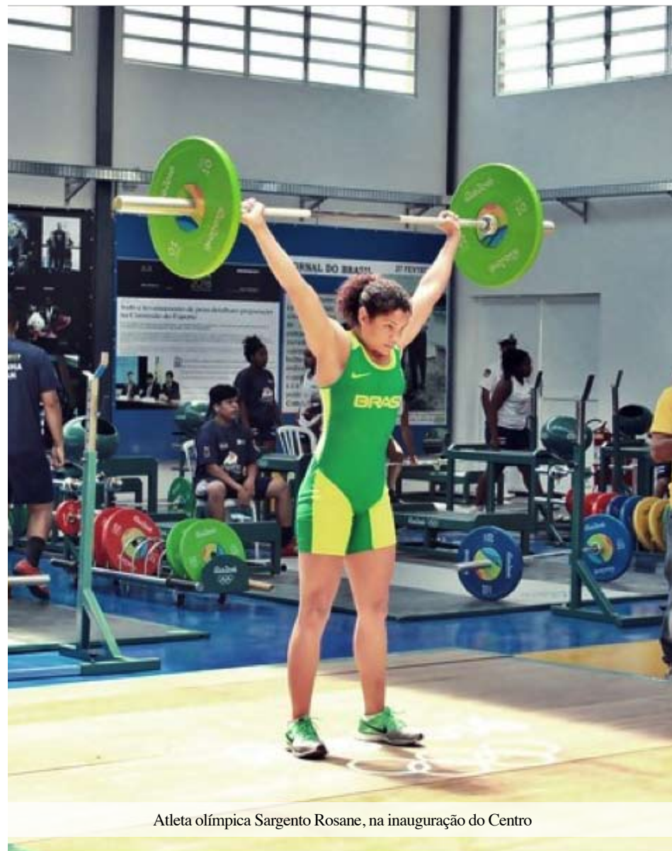
Atleta olímpica Sargento Rosane, na inauguração do Centro

A utilização das novas instalações permitirá um grande incremento nos significativos resultados já obtidos no CEFAN, representando um passo importantíssimo para o sucesso da modalidade e para a preparação para os Jogos Olímpicos e Paralímpicos de Tóquio 2020. •