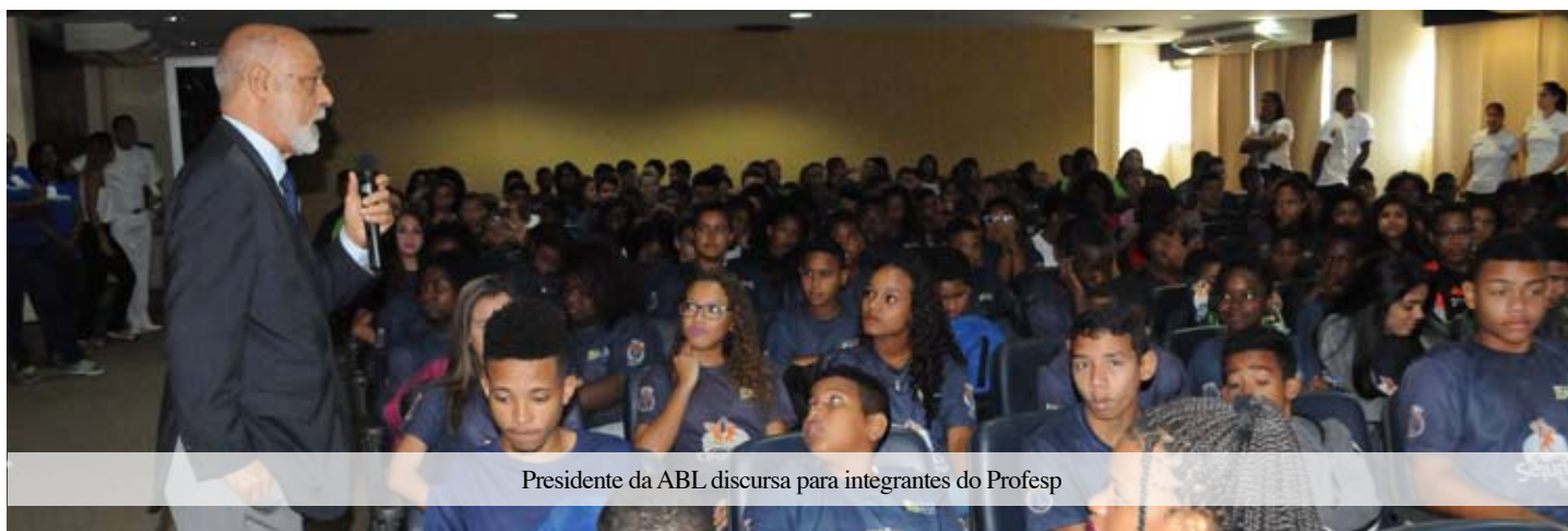
Presidente da ABL discursa para integrantes do Profesp