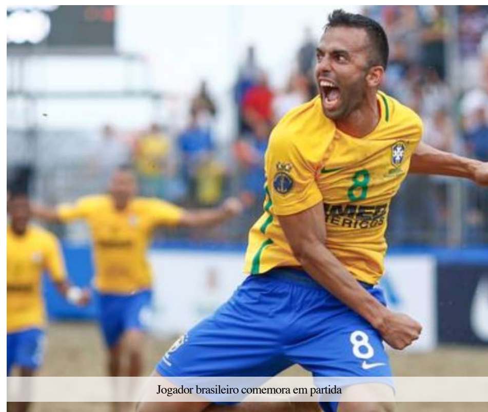
Jogador brasileiro comemora em partida