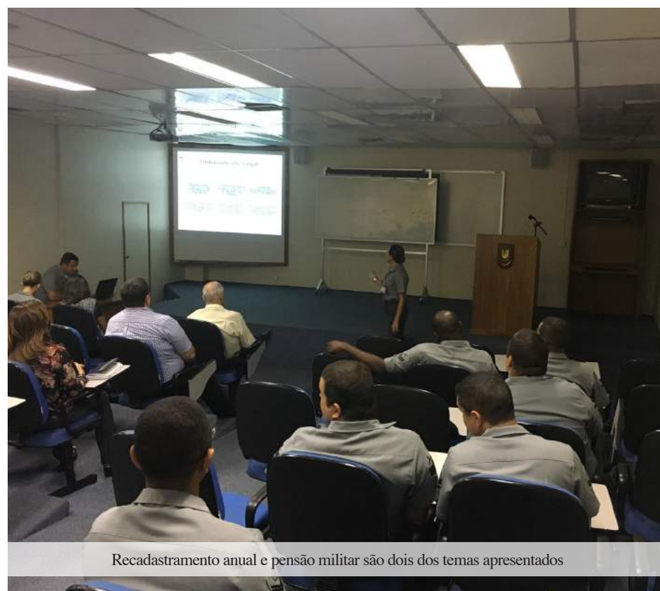
Recadastramento anual e pensão militar são dois dos temas apresentados

presente no dia 8 de maio e ressaltou a importância do projeto: “Estou perto da transferência para a Reserva e não sabia destas informações, que são extremamente importantes, como a obrigatoriedade do recadastramento anual”.