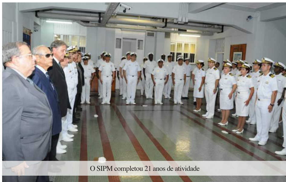
O SIPM completou 21 anos de atividade