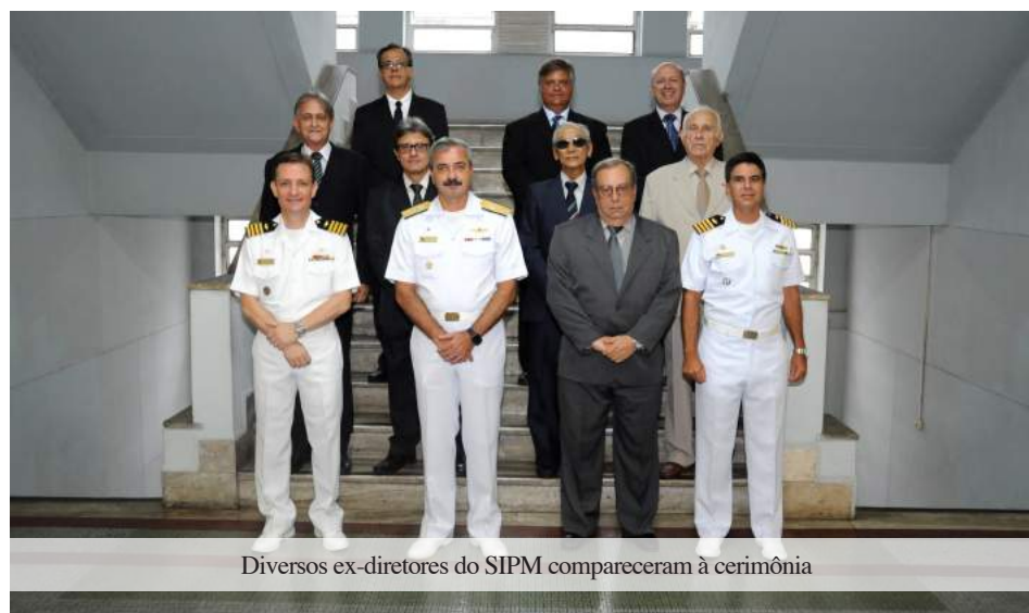
Diversos ex-diretores do SIPM compareceram à cerimônia