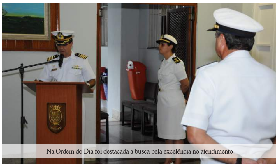
Na Ordem do Dia foi destacada a busca pela excelência no atendimento