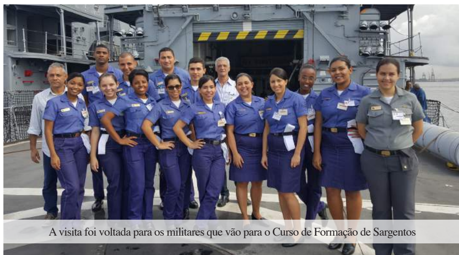
A visita foi voltada para os militares que vão para o Curso de Formação de Sargentos