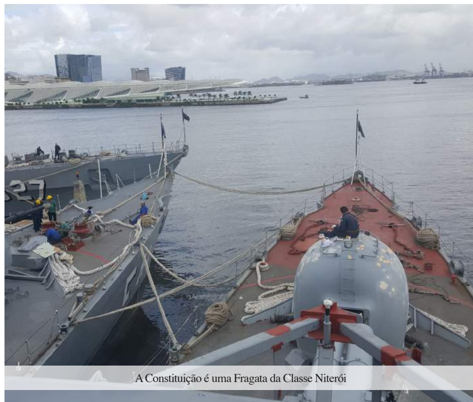
A Constituição é uma Fragata da Classe Niterói