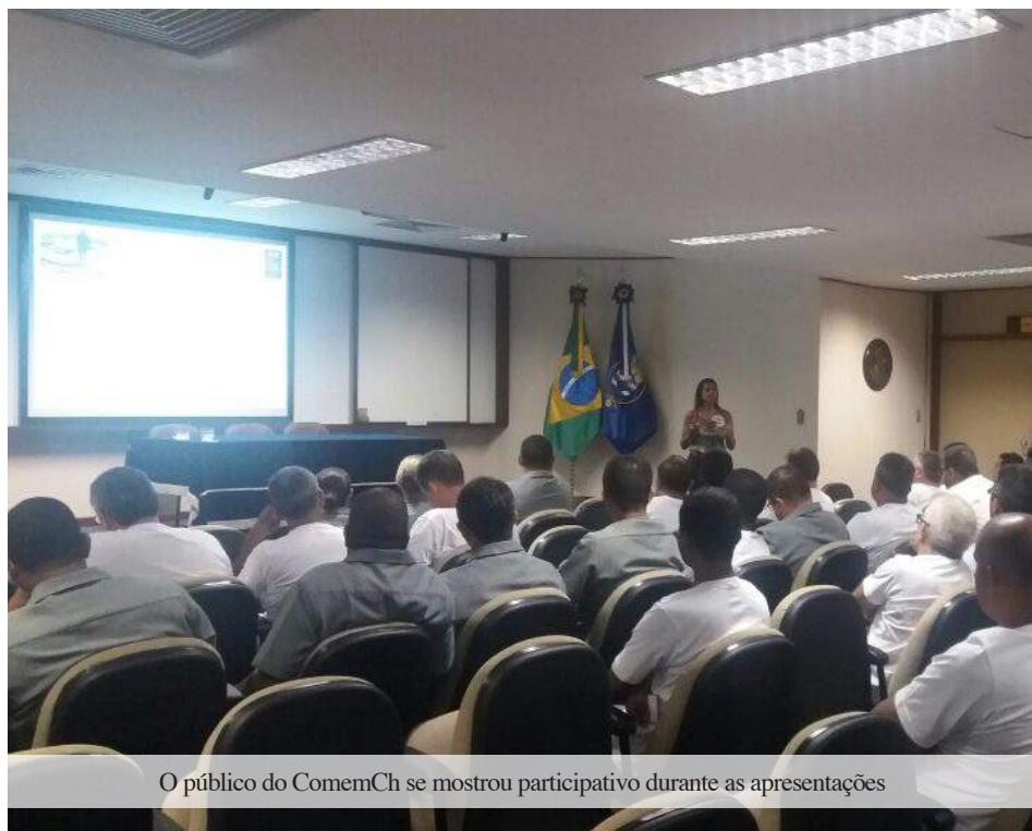
O público do ComemCh se mostrou participativo durante as apresentações

O Serviço de Inativos e Pensionistas da Marinha (SIPM) abriu o ano do “SIPM Itinerante” com palestras no Comando em Chefe da Esquadra (ComemCh), no dia 11 de abril. O projeto, que tem por objetivo esclarecer os principais pontos que geram dúvidas nos assuntos relacionados à inatividade e pensão militar, teve uma outra edição, em 8 de maio, voltada